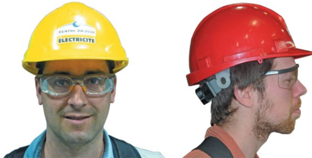
Casque et lunettes